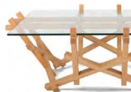
puzzle table PRAKTRIK 5x4