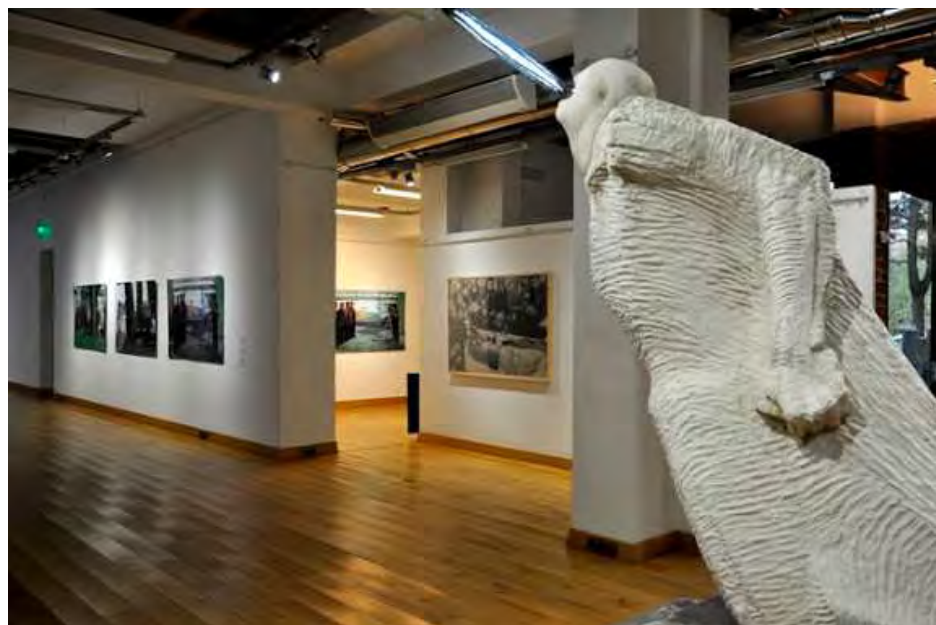
Обща бифокалност с паметника на Занков на преден план.

Силата на проекта не би могла да намери друга опора освен интелектуалния контекст, създаден от произведенията на тримата вече институционализирани автори – специални участници в изложбата.