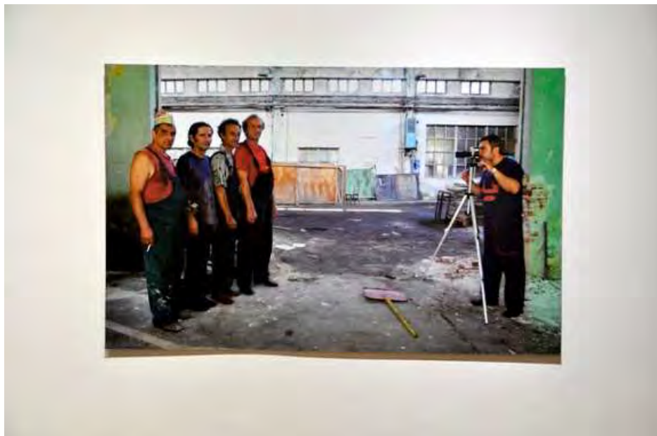
"Правец съвременно изкуство" на Д-р Гатев.

В контекста на музейната изложба произведенията сами по себе си имат разнородно въздействие. Изложбата стои разтрошена, частична, но проблемът, че е съставена от добри творби, надявам се, още повече говори в подкрепа на тезата, че така не се прави изложба, а представянето на съвременно изкуство не е „реденето“ на късно-модерния български мейнстрийм.